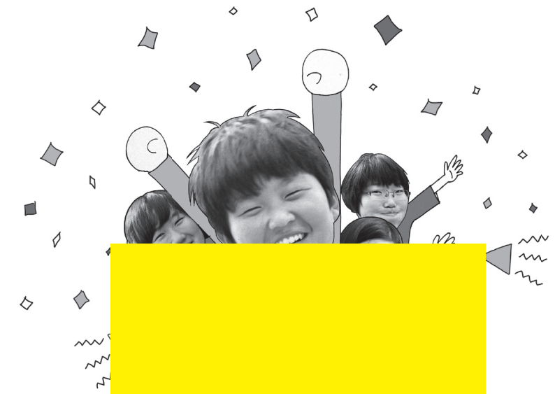
어느 솔로 익명(2학년)